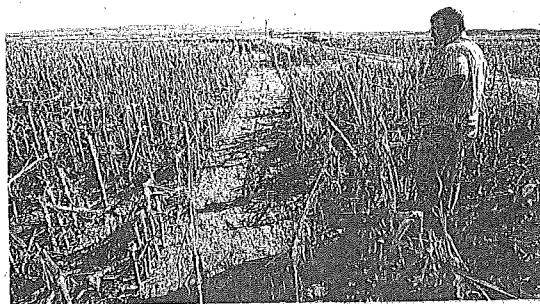
Campo de maíz arrasado por el granizo en julio en Castellforite, a. g.

Según el balance que hizo ayer Agroseguro, el pedrisco perjudicó especialmente a la mitad norte y al este de la Península con una valoración que podría superar los 85 millones de euros. En total, las