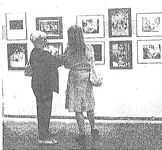
Imagen de archivo de la exposición de la pasada edición del concurso. s.e.

En esta edición se otorgarán premios por valor de 1.450 euros, en concreto se entregarán tres galardones: 600 euros para el primer clasificado, 350 para