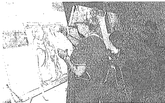
Imagen de archivo de alumnos del taller trabajando con la técnica del fresco.