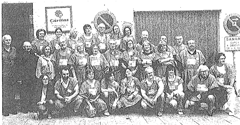
Foto de familia de alumnos, profesores y organizadores del taller.

Hay que señalar que todos los motivos pictóricos elegidos esta edición proceden de Bagüés y que se centran en escenas como la Resurrección o la Anunciación. "Hemos seleccionado algunas partes y no la pieza completa, porque era muy complejo de realizar", dijo Garrido, que conforma el equipo docente, jun-