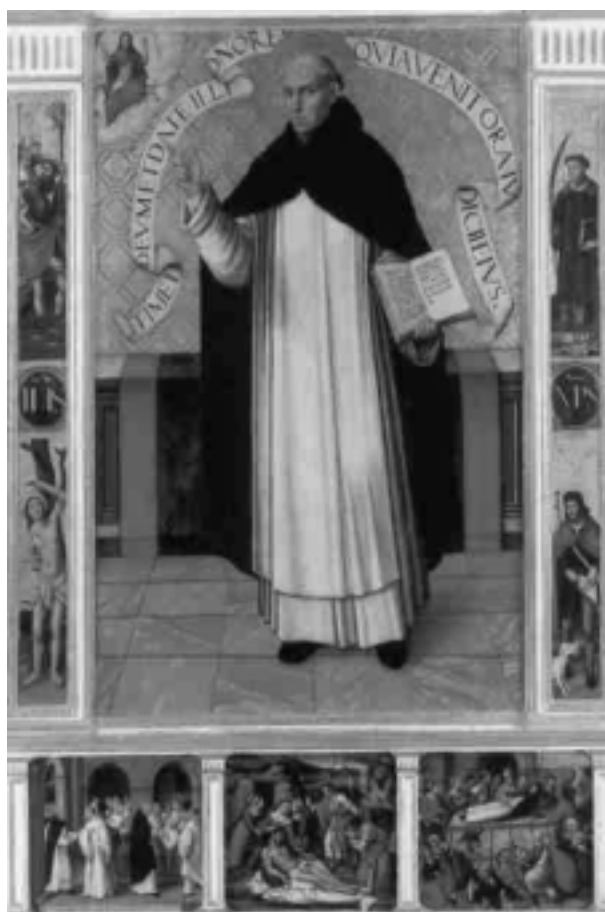
10. Retablo de San Vicente Ferrer . Vicente Macip. Museo Catedralicio, Segorbe.

da por los donantes con vistas a su salvación en la hora del juicio postrero. Yarza 58 llama la atención sobre la Virgen apocalíptica a la que Catalina de Cleves se dirige en oración en el fol. 1 del famoso libro de horas de la Morgan Library (M. 917) con las palabras “O mater dei memento mei”. La intención es la misma que en la tabla del MNAC. Incluso el niño responde también a través de una filacteria que no resulta legible. No hay sin embargo referentes escatológicos explícitos más allá de la demanda de la de Cleves de la intercesión de la Virgen. Estos son sin embargo manifiestos en una miniatura de un libro de horas hispánico del siglo XV conservado en la Biblioteca de El Escorial 59 . En ella una Virgen radiante, en el sentido literal del término, se destaca, flanqueada por dos ángeles, sobre un hermoso paisaje. Una gran boca de Leviatán ocupa toda la parte inferior de la pintura. No se trata del infierno. En su interior varias almas desnudas imploran, juntando sus manos, la intercesión de la Virgen. Son almas del purgatorio.