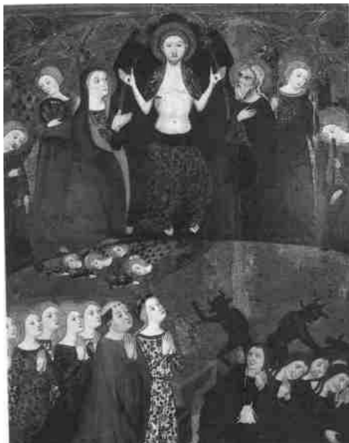
1. Juicio Final . Retablo del Convento del Santo Sepulcro de Zaragoza. Jaume Serra. Museo Provincial. Zaragoza.

sión de dolor, son empujados hacia la eterna condenación. No están desnudos, contrariamente a lo que es más habitual. Tampoco portan atributos que permitan identificar sus faltas salvo en el caso del que cierra el cortejo, que, situado en primer plano, ostenta colgada del cuello la bolsa que lo delata como avaro. Todos ellos se cubren con una común vestimenta negra, reflejo de la oscuridad de sus almas 11 , en contraste con las túnicas floreadas con se visten mayoritariamente los justos, expresión en su caso del gozo que los embarga 12 .