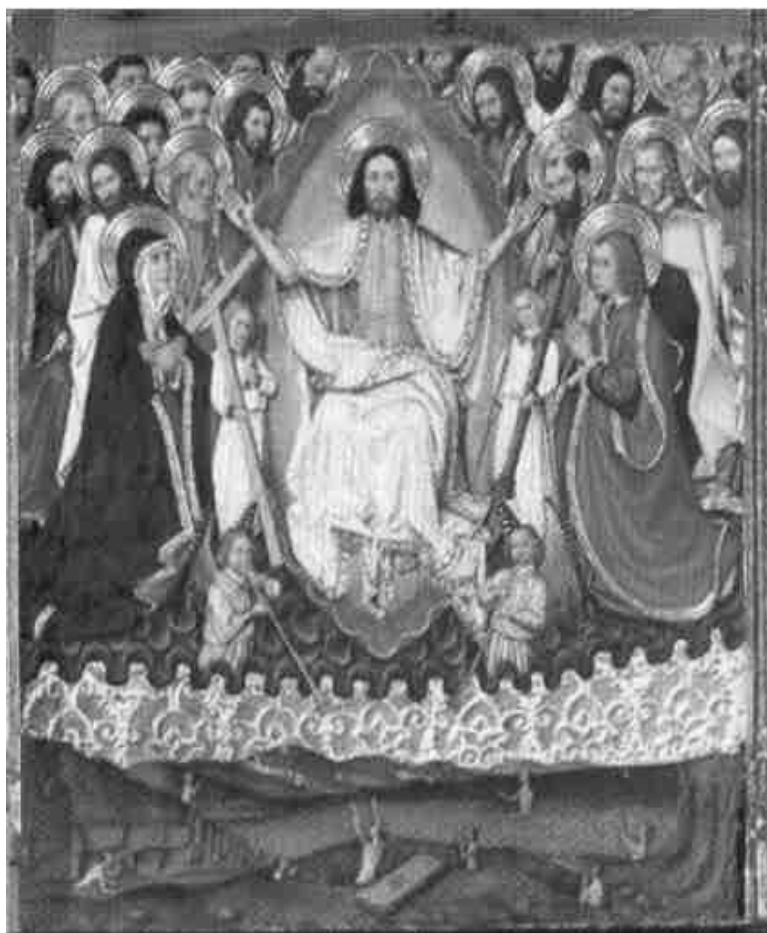
4. Juicio Final . Retablo de la Transfiguración . Jaume Huguet. Catedral de Tortosa.

enviados de Ocozías) mientras que la tercera vuelve a tener como protagonista a Cristo, a través de la representación del Juicio Final 39 (fig. 4).