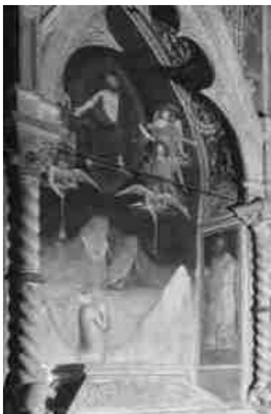
5. Juicio Final . Capilla Bardi di Vernio. Santa Croce. Florencia.