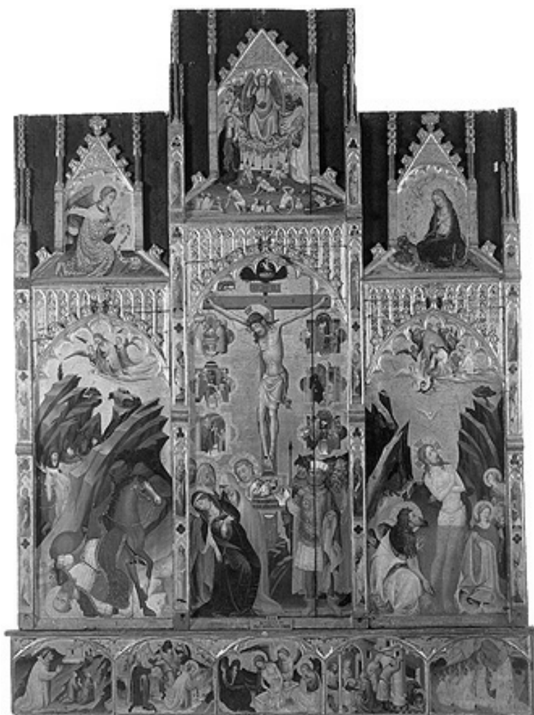
3. Retablo de Bonifacio Ferrer. Museo de Bellas Artes. Valencia.

Cristo, que mana abundantemente de la herida, se dirigen hacia cada una de ellas, estableciendo así un nexo de unión entre la Redención y los Sacramentos. Ellos son el medio a través del cual el cristiano se hace acreedor a los beneficios de la Redención . Constituyen por tanto un instrumento de salvación.