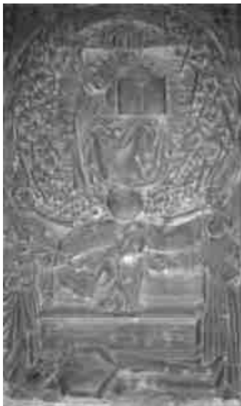
6. Juicio Final . Lauda sepulcral del canónigo Yver. Capilla de Santa Clotilde. Catedral de Notre Dame. Paris

pretaron el episodio del Tabor en clave escatológica, viendo en él la prefiguración de la Segunda Venida de Cristo 48 .