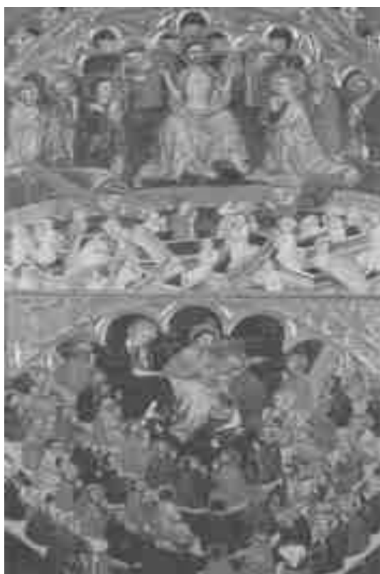
7. Juicio Final y comunión de los santos. Retablo de El Salvador de Albatárrec. Museo Diocesano. Lérida.

La tabla central se flanquea en la calle de la izquierda por la Natividad, Bautismo de Cristo y Transfiguración y en la de la derecha por la Resurrección, Juicio Final y Comunión de los santos. En el ático la habitual crucifixión se acompaña en este caso de sendas imágenes de donantes, probablemente, a juzgar por sus hábitos, clérigos de la catedral, arrodillados en oración en cada uno de los márgenes de la escena principal.