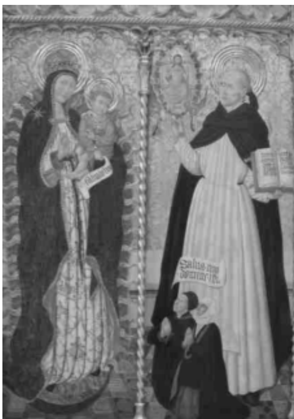
9. Retablo de San Vicente Ferrer . Pere García de Benavarre. Procedente del Convento de dominicos de Cervera. MNAC. Barcelona.

santo pintado en 1523 por Vicente Macip y hoy conservado en el Museo Catedralicio de Segorbe 56 (fig. 10).