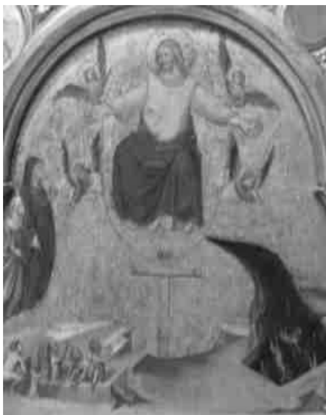
2. Juicio Final. Retablo de la Coronación de la Virgen. Guariento di Arpo. Norton Simon Museum. Pasadena.

general en el Juicio. Como señala Réau la resurrección de Cristo garantiza la de los muertos a través de la ecuación Cristianus alter Christus 13 . Presenta por lo demás una notable particularidad iconográfica. Reencontramos aquí de nuevo al promotor de la obra asistiendo, con la misma actitud y atuendo que en la tabla del Juicio, al milagro de la resurrección de Cristo. Su presencia, al tiempo que manifestación de su devoción particular al Santo Sepulcro, coincide con el mismo anhelo de salvación (expresado aquí a través de la voluntad de participar de la resurrección de los justos) que reitera casi un siglo más tarde Pere Ferrer en el retablo de la Transfiguración de la catedral de Tortosa, objeto de nuestra atención en páginas sucesivas.