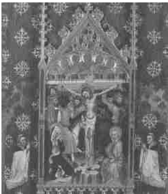
8. Crucifixión y donantes. Retablo de El Salvador de Albatárrec. Museo Diocesano. Lérda.

parecer, de un retablo dedicado a San Vicente Ferrer del convento de dominicos de Cervera. Procedentes de la colección Fontana, se cuentan hoy entre los fondos del MNAC (inv. 114.749) 55 [fig. 9].