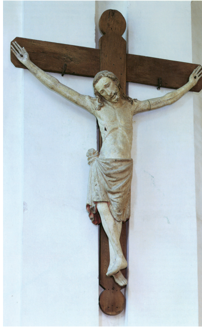
Fig. 7. Crucifijo de la iglesia de St. Katharinental 1300. St. Katharinental, antigua iglesia monástica.

Pero de las Vidas pueden extraerse todavía más referencias a las obras de arte existentes en St. Katharinental y a la relación que las monjas mantenían con ellas. Así por ejemplo, en la Vida de Mechthild, “la Caballera”, se habla de una imagen del Señor en el sepulcro al que Mechthild se volvía en sus oraciones, tomando entre sus manos las manos y pies del Señor 61 . Probablemente, esta figura de Cristo pertenecía al Santo Sepulcro del que proceden también las de los dos ángeles de la Liebighaus de Frankfurt, fechados hacia 1330 y que, al contrario que la de Cristo, sí que se han conservado 62 .