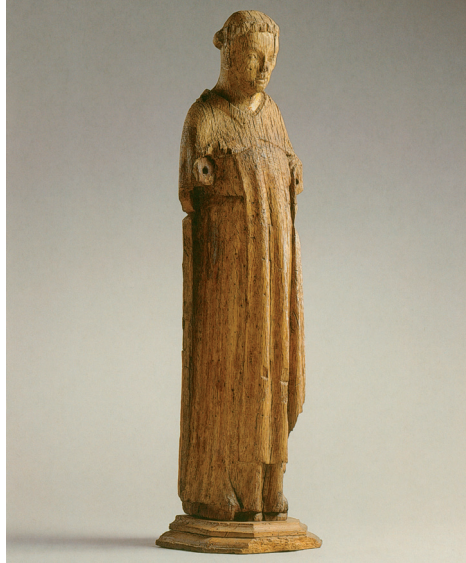
Fig. 6. Estatua de madera de Santo Domingo, 1300/1305. Weesen, Monasterio de dominicas Maria Zuflucht.

gran crucifijo que se inclinó hacia otra de las monjas llamada Adelheit, cuando estaba ante él con dos hermanas más, y le abrazó pronunciando la palabra Avete! , usando con ella el saludo que –así lo explica el Libro de monjas – había dirigido a las tres mujeres, cuando se les apareció tras su resurrección 55 . Todas estas cruces debían encontrarse en el ámbito de la clausura. En el caso del gran crucifijo se puede además deducir que no podía estar colgado demasiado alto, por lo que difícilmente puede pensarse en la cruz triunfal, es decir, en aquella flanqueada por las figuras de María y Juan que tenía su origen en una donación de Martín de Stein 56 .