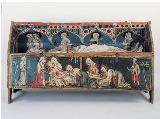
Fig. 10. “Santo sepulchro” o “sepulchro de Pascua” de Maigrage, posterior a 1329. Friburgo, Museum für Kunst und Geschichte, Inv. Nr. MAHF 1995–38.

completas y de maitines 74 . Faltan en cambio por completo indicaciones de que las obras de arte jugaran también algún papel en los ejercicios de meditación colectivos –por ejemplo en relación con el oficio de María o de la Cruz, en los cuales a cada hora canónica iba asociada la rememoración de una estación de la Pasión de Cristo 75 , lo cual no excluye que algunas de las monjas fijasen su atención en alguna de las muchas obras de arte presentes en el coro 76 . Pero no se puede documentar con seguridad.