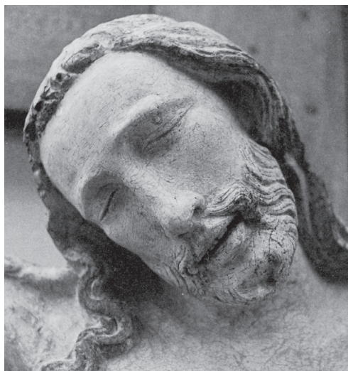
Fig. 8. Detalle del llamado “gran crucifijo” (véase fig. 7). St. Katharinental, antigua iglesia monástica.