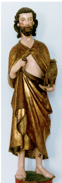
Fig. 5. Figura de pie de Juan el Bautista, 1300. Karlsruhe, Badisches Landesmuseum, Inv.-Nr. L10; préstamo permanente del Musée des Arts Décoratifs, París, inv PE 484.

Otra monja, Richmut de Winterthur, estando enferma, recorría una vez después de maitines el claustro y, cuando llegó al portón, se inclinó ante el crucifijo allí colgado y se lamentó a Cristo de sus dolores, por lo que éste le consoló recordándole su propio sufrimiento 49 . Se trataba probablemente de la misma cruz ante la que también Adelheit Othwins se arrodilló una mañana cuando se dirigía al Capítulo. Dice el texto que Adelheit una vez, después de Pascua, al acabar