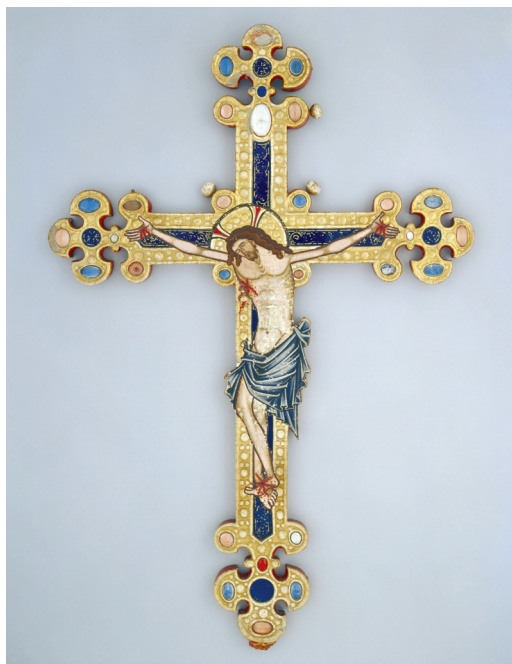
Fig. 9. Cruz de altar o procesional de St. Katharinental hacia 1250/1270. Basilea, Historisches Museum, Inv.-Nr. 1905-1970.

les asaltaban dudas sobre su propia vocación. Parece como si a Cristo, que con su sacrificio había tomado sobre sí el mayor dolor posible, se le creyera capaz por su propio sufrimiento de la máxima comprensión. María, por su parte, era reivindicada sobre todo como maternal consoladora, y se tiene la impresión de que ella actuaba casi como interlocutora real asumiendo así el papel que les estaba vedado a las hermanas de comunidad a causa del precepto de silencio prescrito por la regla. Aquí nos encontramos ante una forma de comprensión de las imágenes que desde el inicio del arte cristiano la Iglesia oficial había tolerado sólo con gran desconfianza: es decir, la que equipara la imagen con el modelo original, o la que identifica la persona representada con su representación artística. Cuando las monjas, de rodillas ante una imagen de María o del crucifijo, dialogaban con ella, hablaban en realidad con la Madre de Dios o con el Crucificado y los percibían como presentes. No se trata pues aquí de la imagen como imagen devocional en el sentido de un medio para estimular la meditación, ni de la imagen como mediadora en la contemplación de los acontecimientos de la historia de salvación con vistas a su imitación mental, como