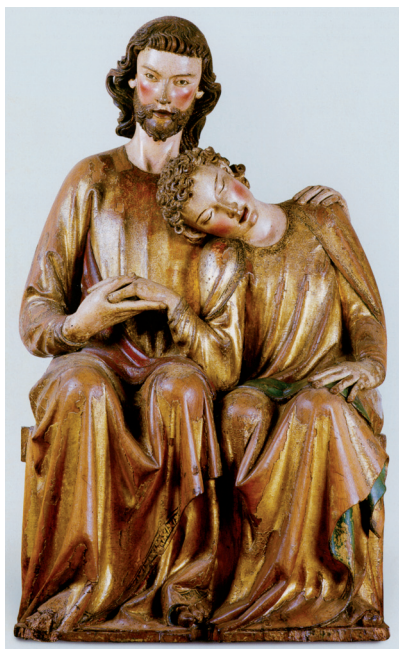
Fig. 3. Grupo de Cristo y Juan de St. Katharinental. Amberes, Museum Mayer van den Bergh, Inv.-Nr. 2094.