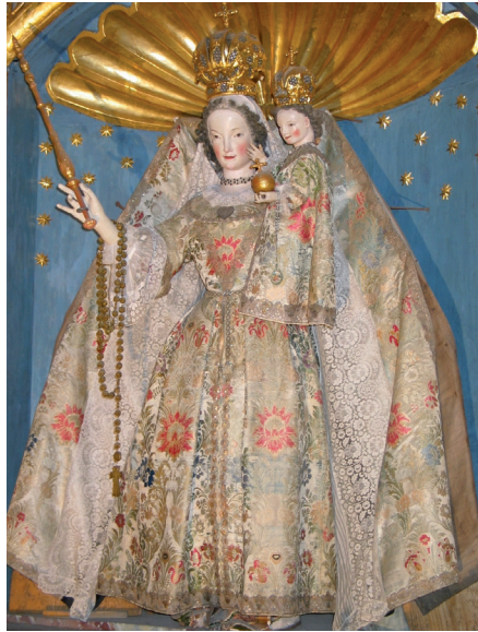
Fig. 4. Estatua de la Virgen con el Niño, 1300-1305, retocada en 1745 como Madonna vestida barroca. St. Katharinental, antiguo monasterio.

En este último caso parece haberse tratado de una Virgen en trono. La imagen de María que tiene en brazos a Nuestro Señor 42 , mencionada en la otra Vida, debía tratarse en cambio de una figura en pie, a propósito de la cual es natural remitirse a la talla de madera policromada de María en pie con el niño que todavía hoy se encuentra en la iglesia de St. Katharinental, si bien retocada en una reelaboración barroca (fig. 4) 43 .