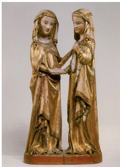
Fig. 11. Visitación, fechada alrededor de 1320. Nueva York, Metropolitan Museum of Art, Inv.-Nr. 17.190.724.