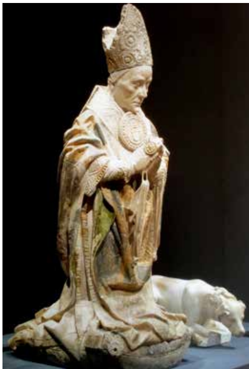
Fig. 8. Efigie del obispo Lope de Barrientos (†1469). Atribuida a Egas Coeman, ante quem 1454. Procedente del Hospital de la Piedad de Medina del Campo. Ahora en el Museo de las Ferias, Medina del Campo

A través de este párrafo habla de nuevo el patrono de una fundación que existe por y para él y en esa coyuntura le es lícito apropiarse para su enterramiento de la zona más relevante del espacio cultural, la contigua al altar, de cuya proximidad, entiende, derivarán mayores beneficios espirituales para su alma. En el documento se menciona el simulacro que va a evocarlos tras su muerte y que se sitúa en el epicentro del espacio funerario. Es lo único que ha sobrevivido de la fundación. La efigie de Lope de Barrientos, depositada en la actualidad en el Museo del Prado 68 , deviene un elemento capital en nuestro discurso puesto que se trata de una escultura en alabastro de tamaño algo mayor que el natural que le muestra vestido de pontifical, arrodillado solemnemente y con las manos en oración (Fig. 8). No disponemos de ningún documento acreditativo sobre la autoría del sepulcro, pero la relación del prelado con el maestro flamenco afinado en Toledo, Hanequín de Bruselas, hermano de Egas Coeman, ha llevado a atribuirlo a este último 69 . Aunque en la ca-