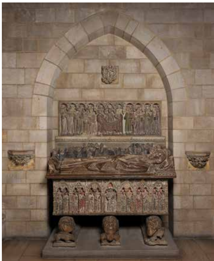
Fig. 1. Sepulcro del conde Ermengol de Urgell (+1314) en Bellpuig de les Avellanes (Lleida). Ahora en el Metropolitan Museum de Nueva York

lugares de paso hacia el más allá. Ayuda a ello el que, en ciertos casos, el diseño de estos vanos ciegos reproduzca, simplificándolo, el de las portadas contemporáneas. Esta ambigüedad es perfectamente perceptible en el claustro alto de la catedral de Burgos, cuya vocación funeraria está largamente acreditada en el tiempo.