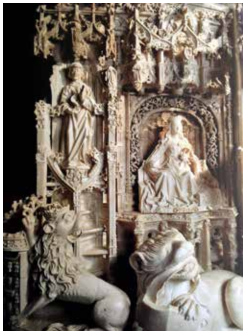
Fig. 4. Detalle del sepulcro real de Miraflores

que fagan sus repisas de sus lanpetas pinjantes los que vienen en las tubas. E entre pilar e pilar en la pieça plana que vaya sus estorias en cada pieça una virtud 25 .