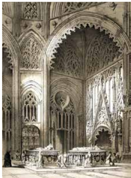
Fig. 6. Capilla del Condestable en la catedral de Toledo.

Genaro Pérez de Villamil, España artística y monumental, Luna tuvo capacidad decisoria, y se trataba de un monumento cuyo rasgo más sobresaliente radicaba en la presentación del difunto como