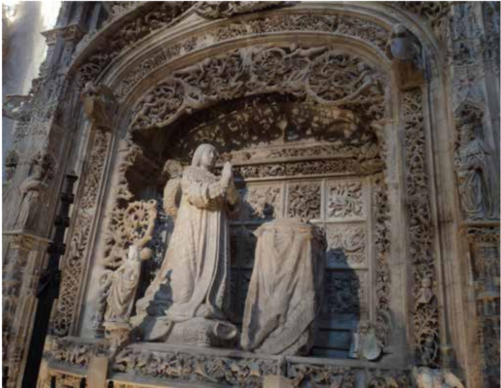
Fig. 10. Sepulchro del Infante Alfonso (†1468) en la cartuja de Miraflores. Gil de Siloe 1489

del conde de Buendía (†1482) en la iglesia parroquial de Santa María de Dueñas, en Palencia 90 . En uno y otro las arquitecturas que envuelven la efigie orante, siendo de gran calidad de ejecución, reproducen vidrieras góticas o motivos afines, algo puramente ornamental y alejado de la ficción formal y del artificio que domina en los nichos-oratorios de Guadalupe y Miraflores.