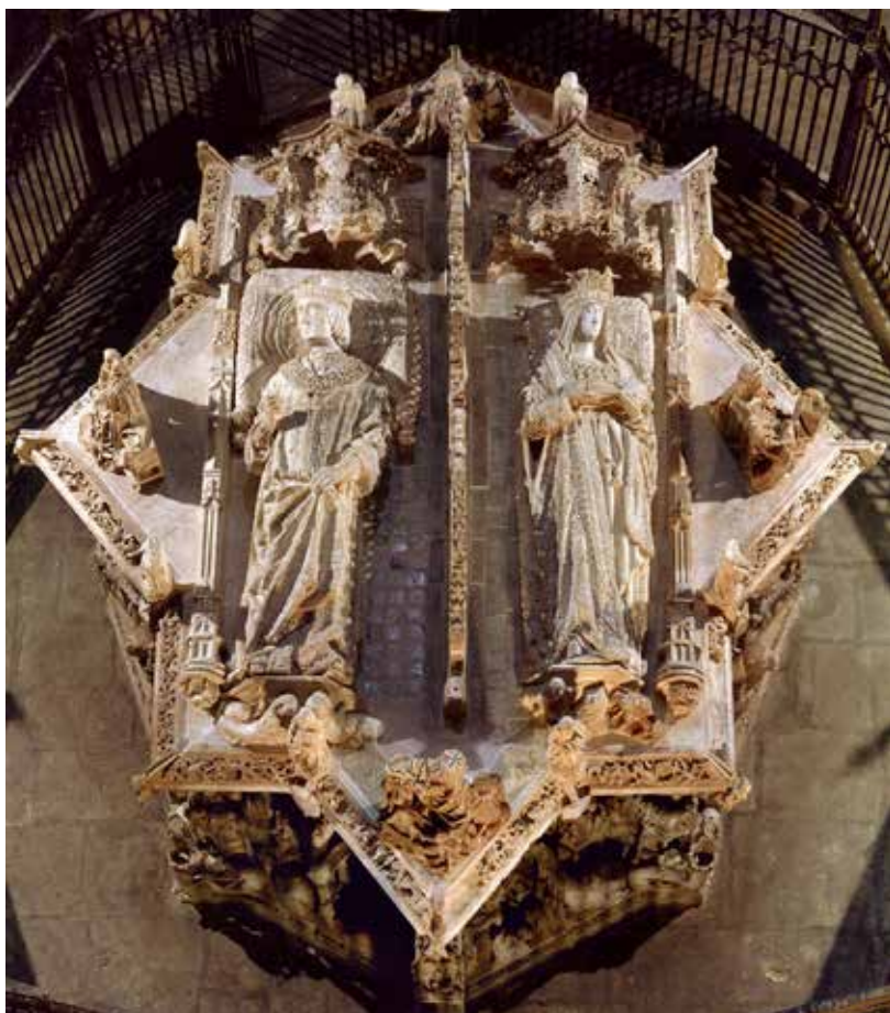
Fig. 3. Sepulcro de los reyes Juan II e Isabel de Portugal en la cartuja de Miraflores. Gil de Siloe, 1489