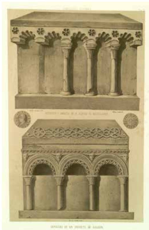
Fig. 2. Sepulcros desaparecidos del monasterio de Montearagón (Huesca) dibujados por Valentín Carderera, Iconografía Española.

Como en muchas otras cuestiones “medievales” hay que admitir para el claustro una cierta ambigüedad semántica. Por un lado debemos atender a la dimensión simbólica que las fuentes documentales reiteran; por otro, su uso cementerial, en el contexto de la economía de la salvación, obedece a intereses muy prosaicos. Las disposiciones de los cabildos de Lleida (1343) y Sigüenza (1353) 14 , entre otras, son bien categóricas en este sentido: cada una de sus galerías, en relación directamente proporcional a una mayor o menor distancia de la iglesia, epicentro de los principales rituales salvíficos y donde se custodian las principales reliquias, se reserva a grupos sociales específicos, con lo cual se establece una jerarquía topográfica bien elocuente.