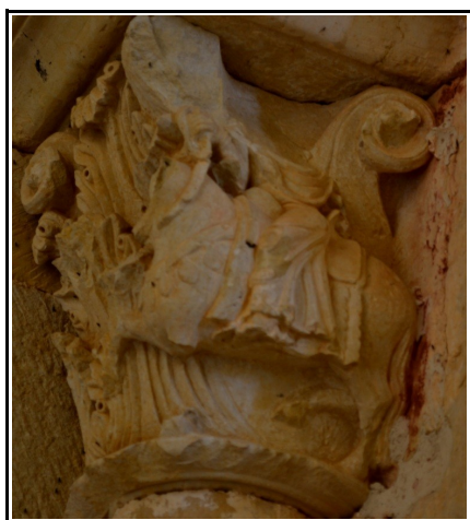
Capitel del presbiterio donde podemos ver la representación de un personaje a caballo, muy maltratado.