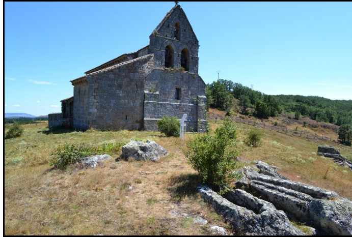
Imagen de la iglesia de San Martín en Quintanilla de la Berzosa, se puede ver su bella espadaña a cuyos pies se ven algunas de las tumbas que forman parte de la necrópolis medieval.