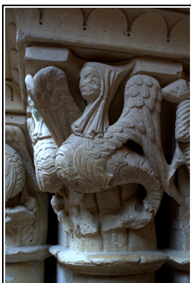
En este capitel de la portada de Revilla de Santullán podemos ver la representación de una arpía.

representación de las arpías es muy habitual, las encontramos en la iglesia parroquial de Gama, en la iglesia de San Martín situada en Matalbaniega, en la iglesia de Pozancos, en la iglesia de San Cornelio y San Cipriano de Revilla de Santullán, en la iglesia de Santa Eufemia de Cozuelos de Olmos de Ojeda y en la ermita de Barrio Santa María.