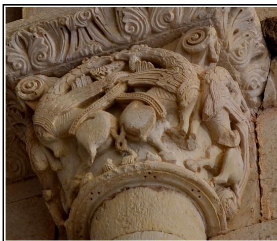
Cuatro grifos en el capitel del arco toral de la ermita de Santa Cecilia.