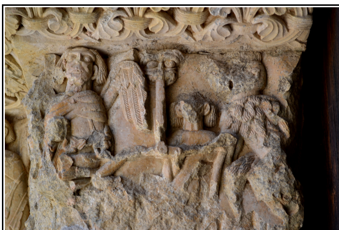
Representación en piedra de la Psicostasis, portada de la ermita de Santa Cecilia de Vallespinoso de Aguilar.