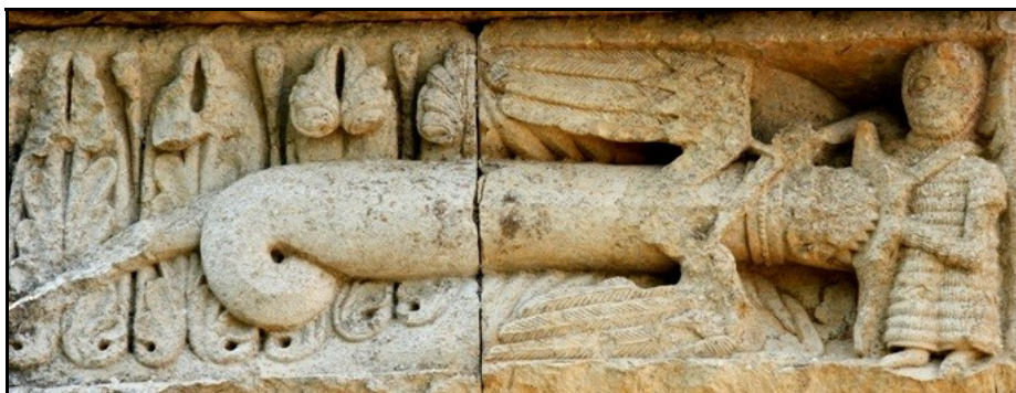
Capitel de la portada donde vemos la representación del Miles Christi con el dragón.

nuestro Señor Jesucristo venció en la cruz a la muerte así el caballero debe vencer y destruir a los enemigos de la cruz con la espada. La lanza se le da al caballero para significar la verdad, el yelmo significa vergüenza, loriga es castillo y muralla contra vicios y faltas, las calzas de hierro que se usa para asegurar sus pies y piernas indican la obligación que tiene de mantener seguros los caminos con el uso del hierro, las espuelas con las que pica a su caballo significan diligencia, la gola obediencia, la maza fuerza del corazón, el puñal llamado misericordia y que se emplea en el cuerpo a cuerpo es símbolo de que no debe confiar solo en sus armas y en su fuerza sino que debe acercarse a Dios. Escudo se le da al caballero para significar oficio de caballero, pues así como el escudo lo pone el caballero entre sí y su enemigo, así el caballero está en medio entre el rey y su pueblo. Y así como el golpe hiere antes al escudo que el cuerpo del caballero, así el caballero debe situar su cuerpo delante de su señor, si algún hombre quiere prender o herir a su señor.” 47 El cristianismo concibió la existencia como una dura y permanente lucha contra el Mal, y nada mejor para expresarla que el combate del guerrero y el dragón.