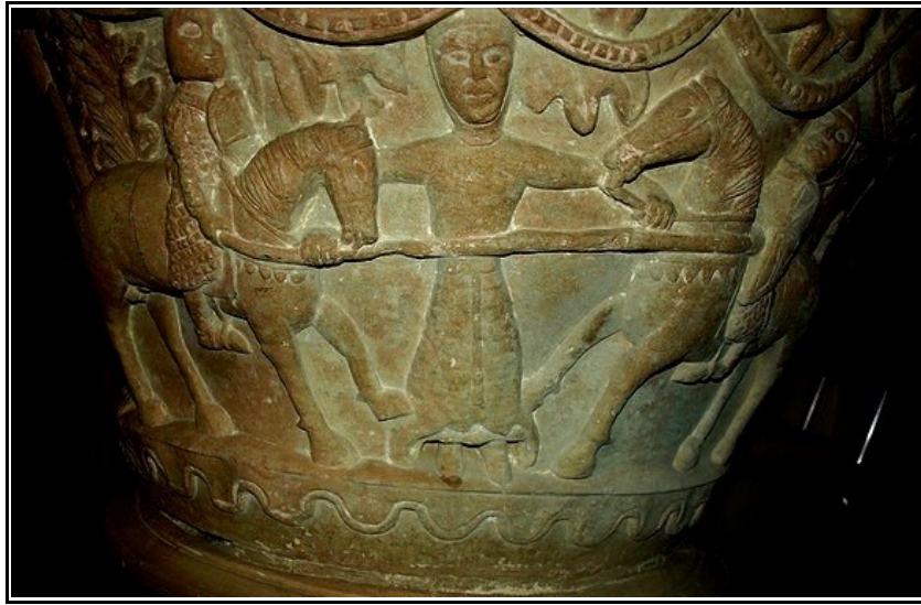
Pila bautismal de Rebanal de las Llantas donde podemos ver un combate a caballo entre dos guerreros con la figura de una mujer actuando de mediadora.