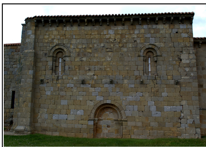
Muros de la iglesia de San Martín Obispo en Matalbaniega, donde se ve perfectamente la utilización de sillares.

Así lo pudo comprobar Miguel Ángel García Guinea cuando en su estudio de las iglesias del románico palentino se acercó a Vallespinoso de Aguilar y vio su ermita, en esos momentos en ruinas con los muros caídos. La anchura de los muros se encuentra en torno al metro y diez centímetros aproximadamente. El empleo de materiales dependerá de la disponibilidad económica que tengan los artífices de la obra, no debemos olvidar que el transporte de los materiales era muy costoso en esta época, se requería de carruajes y animales de tiro, y además las vías de comunicación dejaban mucho que desear.