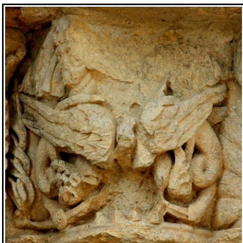
Capitel de la portada con la imagen de dos arpías, una de ellas en muy mal estado de conservación.