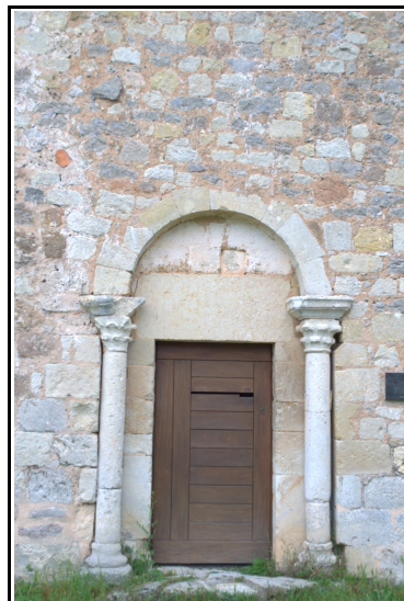
En la imagen de la izquierda se ve el ábside de la ermita de San Pelayo de Perazancas de Ojeda, en la de la derecha podemos ver la puerta de entrada con los dos capiteles prerrománicos.

En el norte de Palencia nos encontramos una gran colección de pinturas murales . En San Cebrián de Mudá por ejemplo se conserva una bella colección de pinturas murales de maestros de la escuela de Nicolás Francés, el mismo que decoró los muros del claustro de la catedral de León. Son pinturas de gran detalle y colorido. Por su parte, en Barrio de Santa María en la cabecera del templo se aprecian restos de pinturas murales románicas del siglo XIII, en las que se intuye lo que fue Pantocrator inscrito en su mandorla, con los símbolos de los Tetramorfos. Así mismo en el muro sur del presbiterio se ve parte de un apostalado y escenas del cielo y del infierno. Donde los muertos son juzgados, vemos como los ángeles y demonios pesan sus almas en una balanza, los bienaventurados con los ángeles mientras que los pecadores son introducidos en ollas por los demonios. En la ermita de San Pelayo de Perazancas de Ojeda se conservan los restos pictóricos más antiguos de Palencia y más relevantes del románico castellano-leonés. La paleta utilizada por el pintor de Perazancas comprendía colores básicos como el blanco, el rojo, el verde o el amarillo que toleraban toda clase