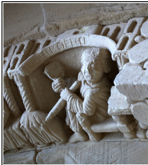
Representación del Maestro Miguel en la iglesia de Revilla de Santullán.