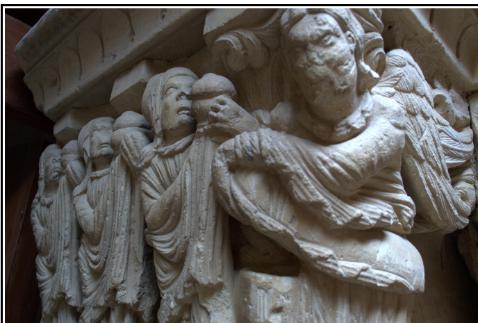
Capitel de la portada de la iglesia de Revilla de Santullán donde puede verse la imagen de las tres Marías.