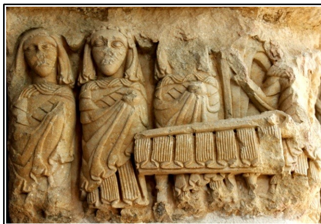
Representación de las Tres Marías ante el sepulcro en la portada de Santa Cecilia. Como podemos observar el capitel ha sido maltratado y prácticamente ha desaparecido el ángel anunciador.