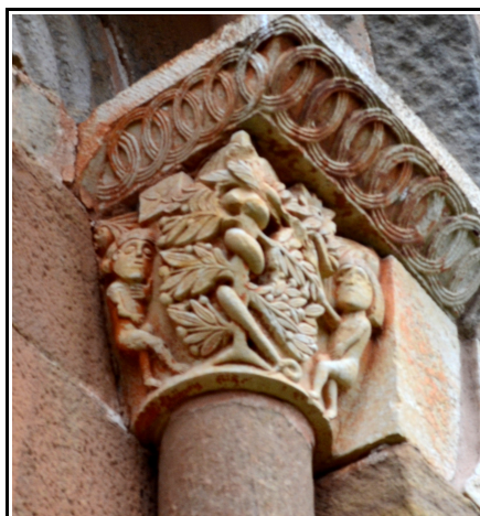
Capitel de “Adán y Eva” situado en el ventanal del ábside de la ermita de Santa Eulalia en Barrio Santa María.