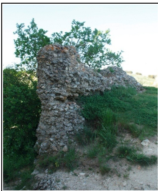
Restos de la posible torre del siglo X situados en la parte de atrás del ábside.