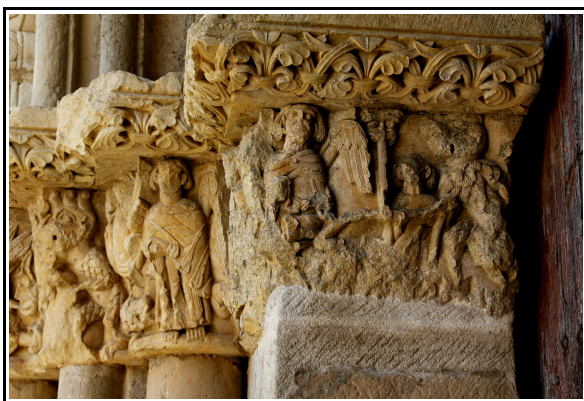
Escena de la psicostasis en la portada de la ermita de Santa Cecilia.