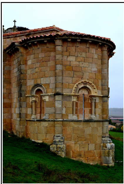
Ábside semicircular de la ermita de Santa Eulalia de Barrio Santa María.