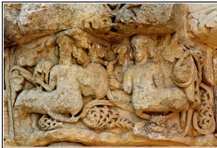
Capitel de la portada donde podemos observar la representación de dos centauros armados.

que permite distinguir los rasgos de su cara, lleva en su mano izquierda un arco. Por su posición enfrentada y su situación delante de las arpías, esta “lucha de centauros” tendría connotaciones negativas, representando la ira y la fuerza. Hay quien va más allá e incluso dice ver un reflejo de la lucha contra el Islam 48 en los capiteles de centauros con arcos. Inés Monteiro Arias defiende esta teoría y se apoya en el hecho de que el uso del arco que portan los centauros es propio de las técnicas militares musulmanas. Esta teoría no sería muy descabellada; no debemos olvidar que el sarraceno es el que amenaza la integridad de los territorios cristianos y la cohesión social, además simboliza la “alteridad religiosa” como adorador de un Dios que no es el verdadero. Mientras que el caballero cristiano simboliza la verdad, el soldado musulmán representa el error, esto llevará a la demonización de su figura, que se percibe incluso en descripciones que se hacen de él como la de Joaquín Rubio Tovar, que nos dice del sarraceno que: “Es un pagano gigantesco, cercano a la animalidad. Es negro, velludo, y sus ojos están inyectados en sangre. Son la viva encarnación de la maldad” . 49 Por lo que no sería raro que el artista románico quisiera representar a este enemigo de la fe con forma de centauro, animal violento como ya hemos visto.