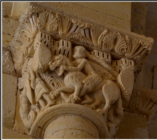
Capitel de "Sansón y el león" situado en el arco toral de la ermita de Santa Cecilia en Vallespinoso de Aguilar.

representaciones este Sansón aparece acompañado de una figura la cual tira de la cola del león, nosotros hemos identificado a este personaje con una mujer (¿Dalila?), pues al observar detenidamente podemos ver que la figura viste amplios ropajes, tiene pelo largo y rasgos de mujer, así puede observarse en Vallespinoso de Aguilar o en el capitel del Monasterio de Santa María la Real de Aguilar de Campoo. 25