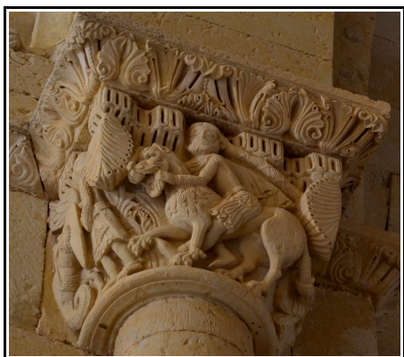
Capitel de Sansón y el león en el arco toral de la ermita de Vallespinoso.