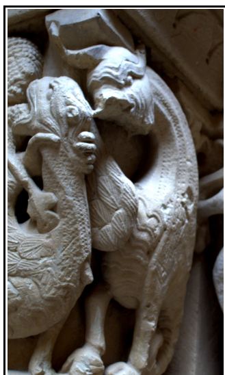
Representación de dragones en la portada de la iglesia de San Cornelio y San Cipriano.

Satanás, el seductor del mundo entero; fue arrojado a la tierra y sus ángeles con él 28 Nos encontramos representaciones de dragones en la ermita de Santa Cecilia de Vallespinoso de Aguilar, en la iglesia de los San Cornelio y San Cipriano de Revilla de Santullán, en la iglesia de San Martín de Matalbaniega, en la ermita de Santa Eulalia de Barrio Santa María, en los capiteles de la portada de la iglesia de Cabria, en el interior de la iglesia de San Lorenzo de Zorita del Páramo, y en la iglesia de Mudá. Como podemos ver la imagen del dragón es muy repetida en el románico del norte de Palencia, unas veces aparecerá junto con el caballero, mientras que en otras representaciones lo encontramos solo.