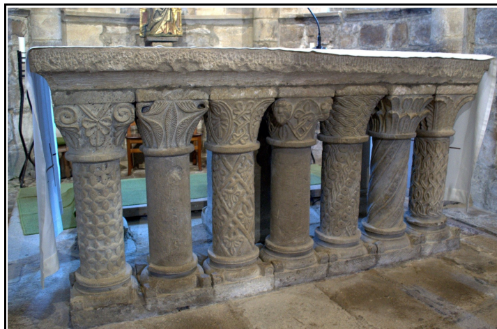
Foto del altar de la Colegiata de San Salvador de Cantamuda.

Podemos ver también altares tan espectaculares como el San Salvador de Cantamuda. El altar de esta colegiata se sostiene sobre columnillas, unas sogueadas y otras lisas, de las que sobresalen capiteles decorados con magníficos relieves de hojas estilizadas, cabezas de hombre, o formas de cuerdas que recuerdan el estilo asturiano. Se trata de un ejemplar único que no volveremos a encontrar en la provincia de Palencia.