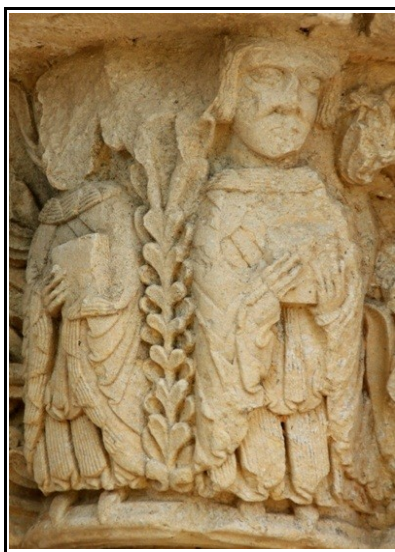
Representación de dos personajes con trajes eclesiásticos en la portada de la ermita de Santa Cecilia, las cabezas aparecen bastante maltratadas.