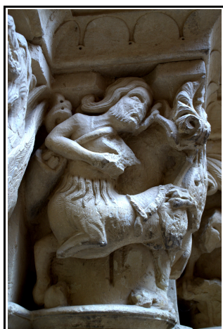
Capitel de la portada de la iglesia de San Cornelio y San Cipriano en Revilla de Santullán donde puede verse la imagen de un centauro.