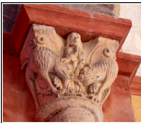
Capitel del interior de la iglesia de San Lorenzo en Zorita del Páramos donde vemos la representación de Daniel en el foso de los leones.