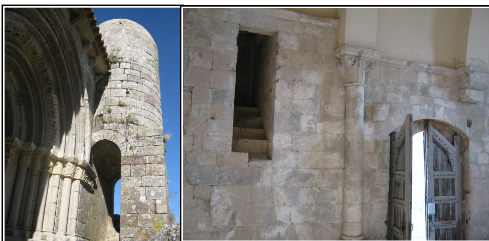
La imagen de la izquierda corresponde a la torre cilíndrica, la imagen de la derecha muestra la subida a la torre.

meridional de la iglesia con la zona trasera del ábside. En la actualidad esta torre se encuentra cubierta por un cascarón de cemento, que se añadió cuando se restauró la ermita en el año 1958. Después de subir y examinar la torre vimos que lo más probable es que en su origen fuera una torre almenada. El acceso a la torre se encuentra en el muro sur, es ahí donde se abre el hueco que alberga la escalera de caracol que permite subir. La altura anormal a la que se encuentra el hueco de la escalera es una de las causas que nos llevan a catalogarla como una torre defensiva, para salvaguardar esta altura y poder acceder a la torre debemos utilizar una escalera supletoria.