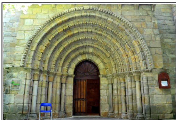
Portada de la ermita de San Juan Bautista de Villanueva del Río Pisuerga, en la actualidad en la Huerta Guadián (Palencia).

con los templos del entorno. Dedicado a San Juan, se trata de una iglesia de una sola nave y reducidas dimensiones, pero muy bien proporcionado. Destaca la gran portada situada en su muro sur, abocinada, con capiteles vegetales y arquivoltas decoradas, pero lo que más destaca es el interior, uno de los más bellos del románico palentino.