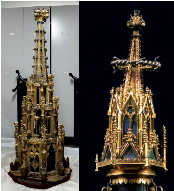
Fig. 2. Izquierda: Maqueta de aguja calada, Museo Municipal de Valencia. Derecha: Marc Canyes, detalle del relicario de la Santa Espina, catedral de Barcelona

Parece evidente que los orfebres y los arquitectos compartían un mismo lenguaje, en lo que respecta a las trazas y el diseño. Muchas piezas de orfebrería son auténticas maquetas arquitectónicas, aunque, con frecuencia, nunca podrían llegar a materializarse como arquitecturas monumentales debido a la fantasía de sus formas. Sin embargo, es en los diseños decorativos donde tenemos que fijar nuestra atención, pues fueron éstos uno de los elementos renovadores de la arquitectura, y es aquí donde se produjo el trasvase de conocimientos.