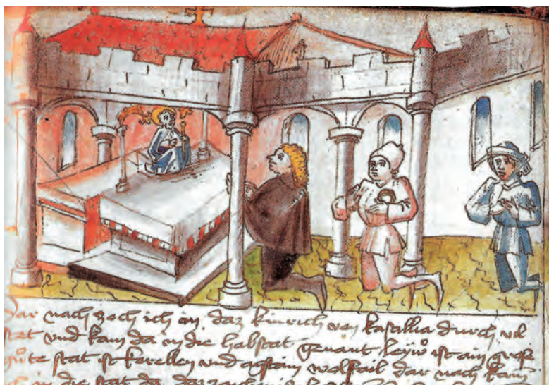
Fig. 3. Sebastian Ilsung en la catedral compostelana, c. 1446, British Library, Ms. Ad. 14326, f. 3v (según Santiago, Camino de Europa , cat. n.º 136)

En los primeros relatos el Apóstol aparece enterrado en su mausoleo milagrosamente (Limoges, Escorial, Montesacro y Panicha) o son sus discípulos quienes lo construyen (Casantense), reutilizan un templo pagano preexistente (Évora) o destruyen éste para construir el mausoleo ( Liber Sancti Jacobi —lib. III, cap. 2— y Fecamp). Por influencia de la leyenda de los “Siete Varones Apostólicos” se introducirán en el relato los episodios relacionados con Lupa. En estas versiones más elaboradas los toros amansados por los discípulos de Santiago se dirigen