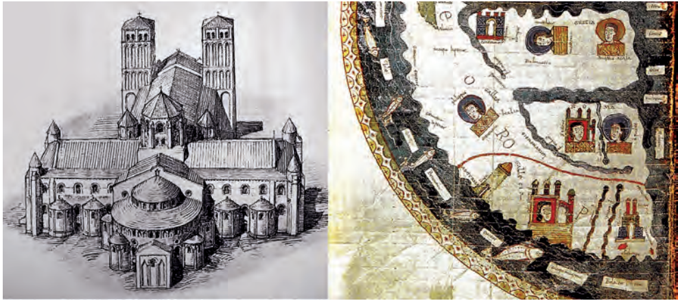
Fig. 1. Reconstrucción de la catedral de Santiago de Compostela y fragmento del Mapamundi del Beato de Burgo de Osma, c. 1086, Archivo de la Catedral de Burgo de Osma, Cod. 1, f. 34v (según Conant, 1983, fig. 43 y Santiago, Camino de Europa , cat. nº 2)

En esta iglesia, en fin, no se encuentra ninguna grieta ni defecto; está admirablemente construida, es grande, espaciosa, clara, de conveniente tamaño, proporcionada en anchura, longitud y altura, de admirable e inefable fábrica, y está edificada doblemente, como un palacio real 4 .