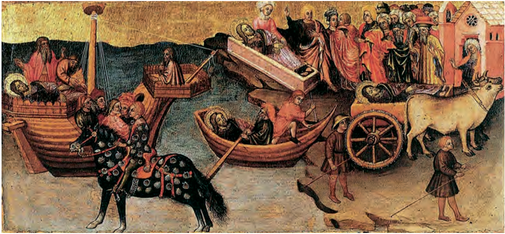
Fig. 4. Tabla de Giovanale de Orvieto, Santa María Araceli de Roma (hoy en el Museo Diocesano de Camerino), 1441 (según Vázquez Santos, 2008, p. 107)

tura basílica aún mantiene las formas palaciegas, muchas veces almenadas, es el caso de uno de los paneles exteriores del retablo mayor de la iglesia de Santiago de Göttingen (Alemania, c. 1402) con Lupa asomándose sobre un esbelto palacio coronado con escaraguaitas (Fig. 5) o la tabla del retablo mayor de la iglesia de Santiago de Rothenburg ob der Tauber (Alemania), pintada por Friedrich Herlin en 1466, con el carro entrando en un palacio flamanquizante 23 . En este punto conviene destacar el interesante ciclo jacobeo realizado al fresco en la capilla de Santiago en San Antonio de Padua, hacia 1377-1379. Hasta tres veces se representa el palacio de Lupa, de grandes dimensiones, estilizado y almenado. En la primera aparece dicha dama observando con expectación, desde su morada, la milagrosa llegada de los restos del Apóstol a Galicia, obra de Jacopo Avanzi. Las otras dos, realizadas por Altichiero, muestran, en primer lugar, la espléndida mansión desde la que Lupa observa cómo se aproxima el carro tirado por los toros con los restos apostólicos. En la escena siguiente se recoge a la derecha el bautismo de Lupa y a la izquierda la consagración de su palacio como iglesia, entre ambos temas se extiende la construcción palaciega, que con sutil cambio se transforma de alcázar almenado a basílica con campanario 24 (Fig. 6), convirtiéndose en el fiel reflejo de la simbiosis palacio-iglesia que observamos en las representaciones de la Translatio .