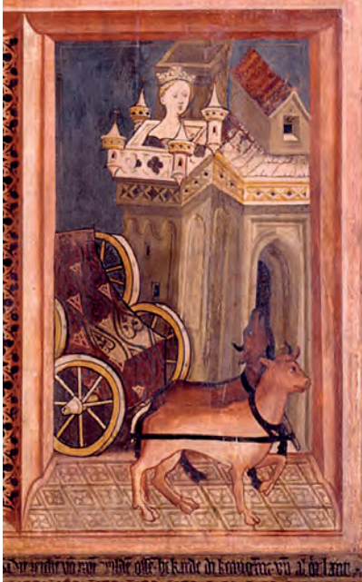
Fig. 5. Panel exterior del retablo mayor de la iglesia de Santiago de Göttingen, c. 1402 (según Carqué y Röckelein, 2005, taf. 11)

castillo. Cualquier peregrino extranjero conocedor de la Leyenda Dorada esperaría encontrarse en Compostela un gran palacio que había sido transformado en iglesia para los restos apostólicos 25 .