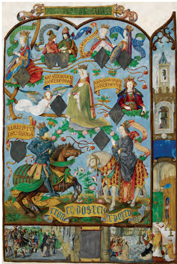
Fig. 7. Peregrinación de la rainha santa Isabel, António de Holanda, 1530-1534. Genealogia do Infante Dom Fernando de Portugal , British Library, Add. Ms. 12531, f. 9bis r (según Santiago, Camino de Europa , p. 427)