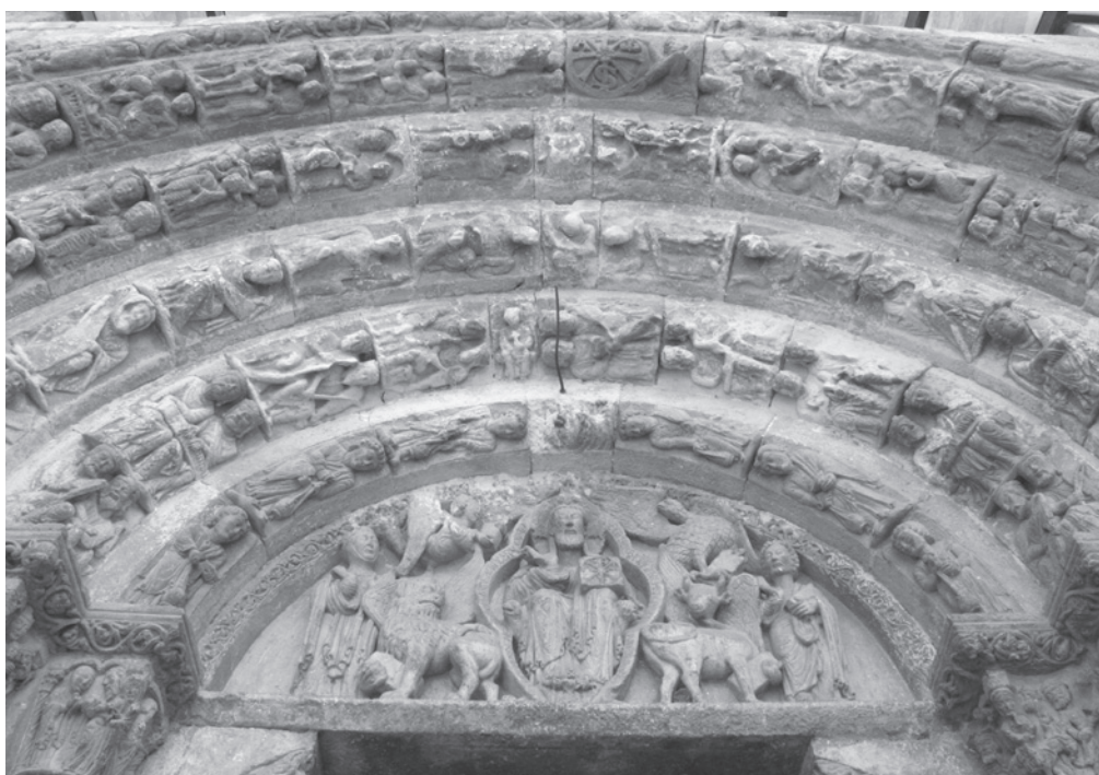
Fig. 5. Roncesvalles, Capilla del Espíritu Santo.