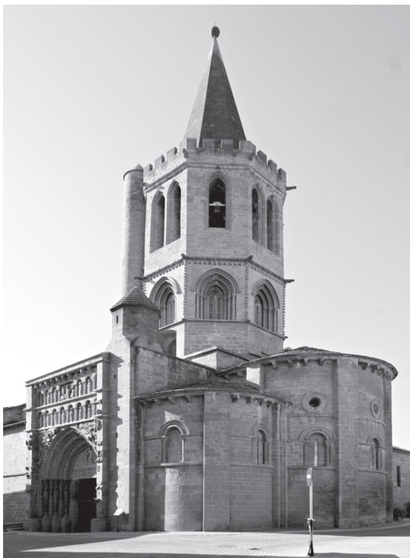
Fig. 4. Santa María de Sangüesa.