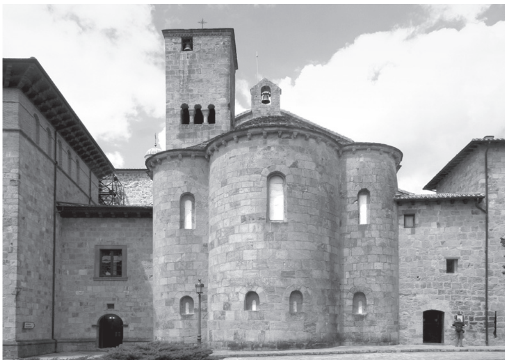
Fig. 1. San Salvador de Leire, cabecera.