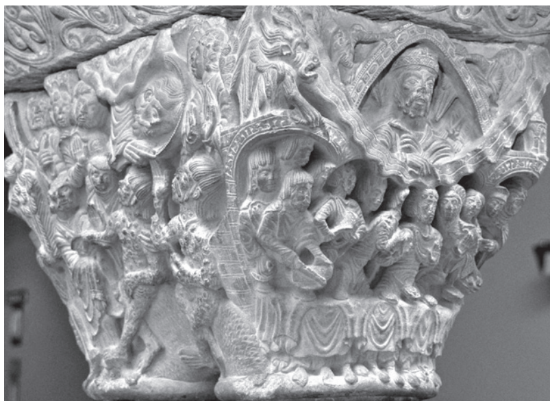
Fig. 3. Capitel con la historia de Job procedente del claustro catedralicio de Pamplona (Museo de Navarra).