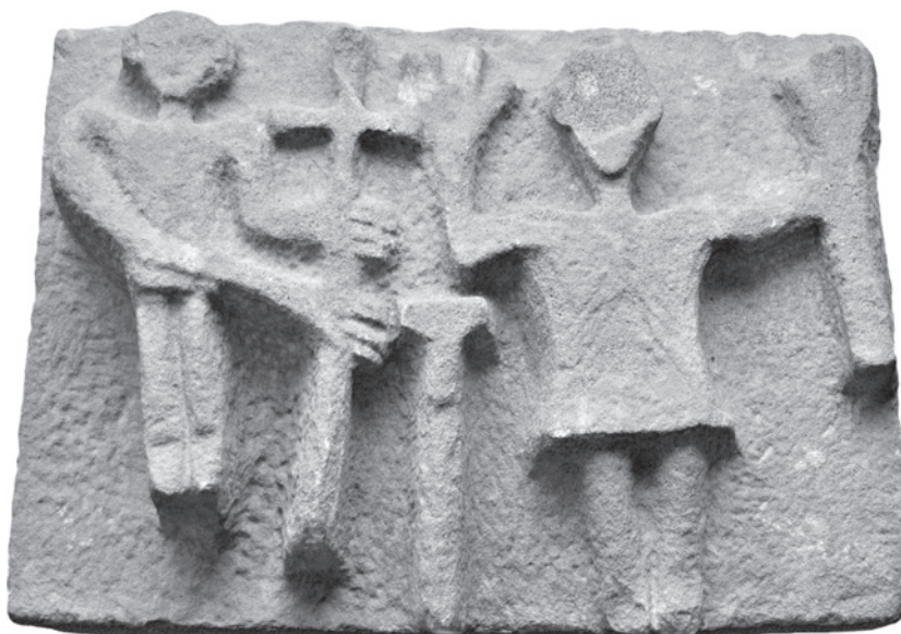
Fig. 2. Relieve procedente de San Miguel de Villatuerta (Museo de Navarra).