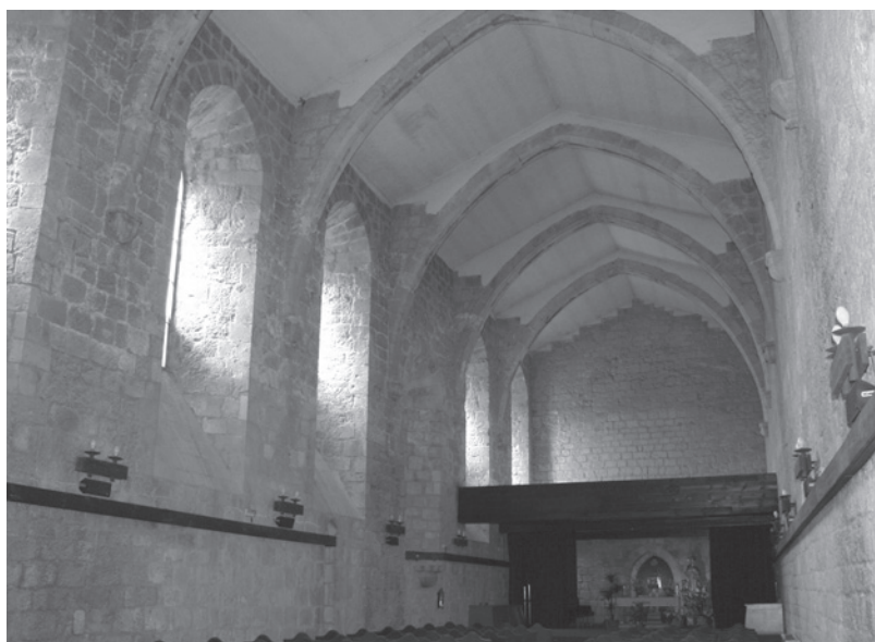
Fig. 8. Santo Domingo de Estella, antiguo refectorio.