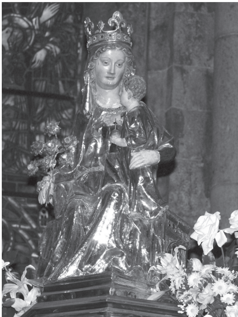
Fig. 7. Santa María de Roncesvalles.